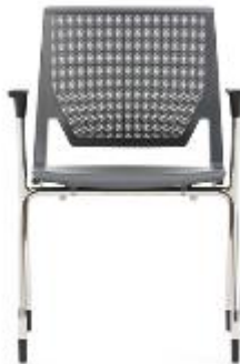
Very Side >