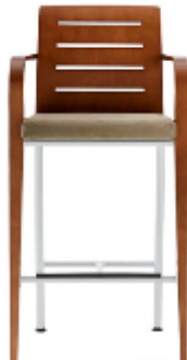
Hello Stool >