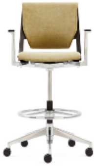
Very Conference >