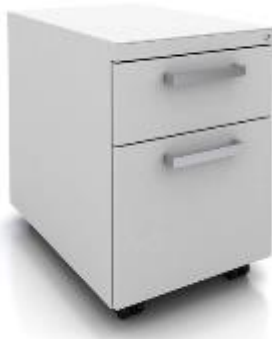
X Series >