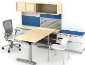
Compose Storage >