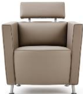
Hello Lounge Chair >