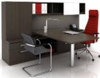
Masters Series (Mostly Storage) >