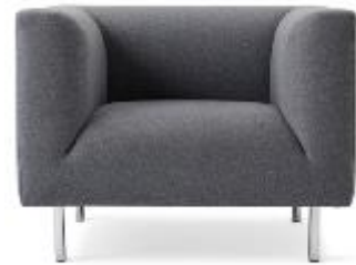
q_bic Lounge Chair >