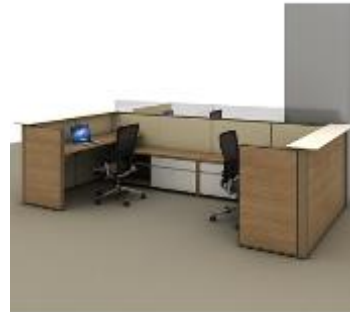
A Series >