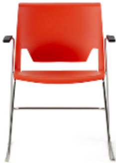
Very Wire Stacker >