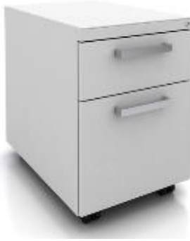
X Series >