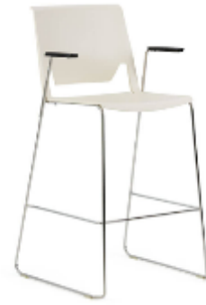
Very Wire Base >