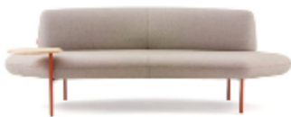
Openest Feather >