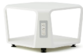
LTB Table >