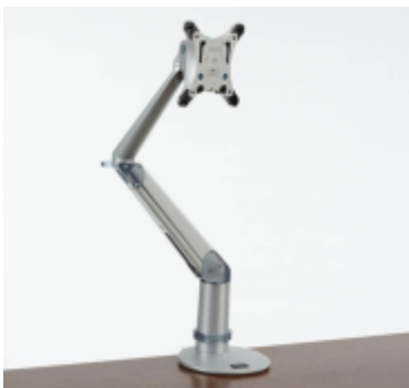
Monitor Arms >