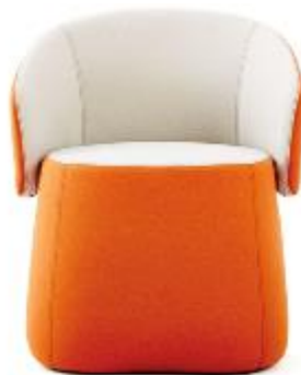
Openest Chick Pouf >