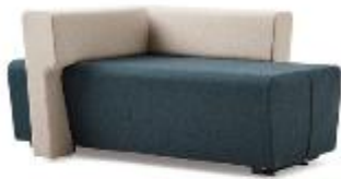
LTB Lounge Chair >