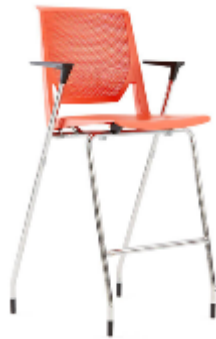
Very Side >