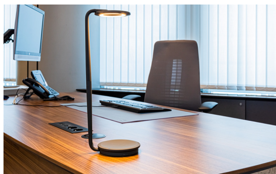
Fernを使用した、欧州議会議員向けの人間工学に基づくソリューション