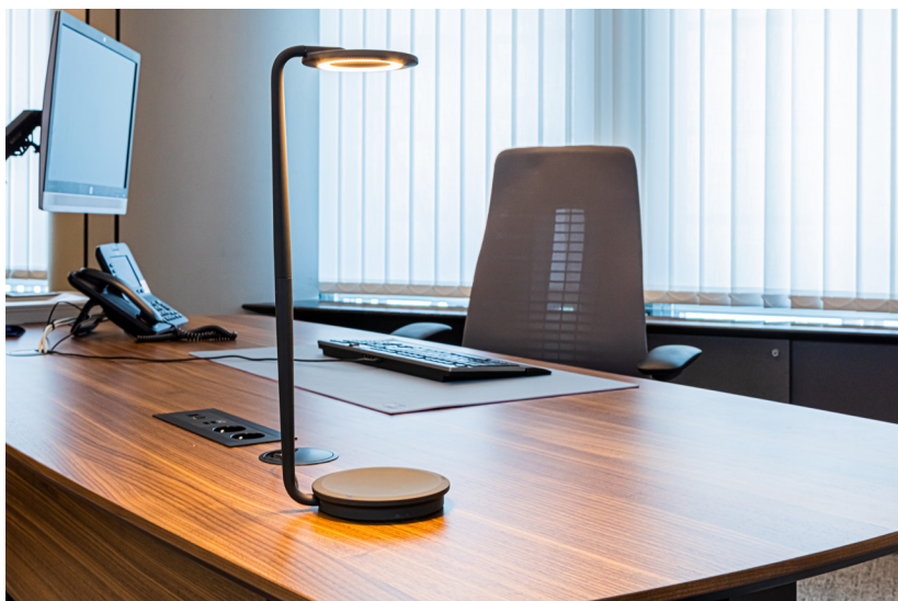
小規模でカジュアルな打ち合わせ用のYourPlace