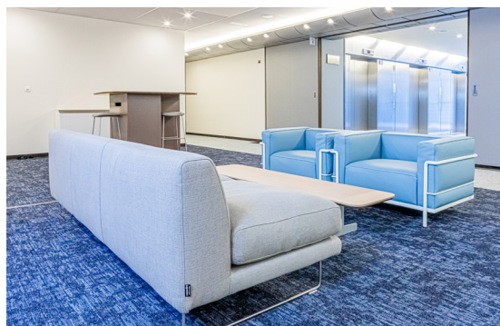
ロビーに置かれたCassinaのLC3とCappelliniのElan

また、ユーザーエクスペリエンスを向上させるために、職場での最適な姿勢と心身の健康を守る方法をすべての方に知っていただけるよう、現地での人間工学トレーニングを実施しました。