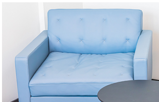
ゲスト用シーティングのKennedeeアームチェア