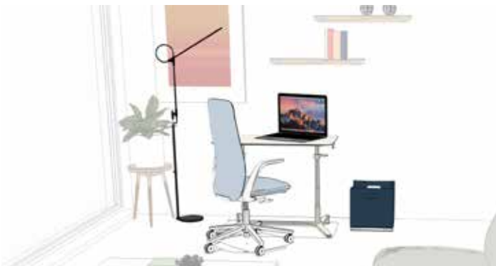
Home Office: Small

Im Home Office arbeiten ist toll. Für eine bestimmte Zeit. Es gibt viele Einflüsse die das konzentrierte Arbeiten oder Conference Calls von zu Hause aus suboptimal oder sogar kontraproduktiv machen. Viele teilen ihr Zuhause mit Mitbewohnern, die einen anderen Tagesrhythmus haben. Oder mit Familienmitgliedern, die spezielle Bedürfnisse haben oder Aufmerksamkeit brauchen - oft Kinder, manchmal auch Eltern oder Großeltern. Für viele ist es in kleinen Wohnungen nahezu unmöglich, einen eigenen abgetrennten Arbeitsbereich zu haben. Viele Schätzungen gehen davon aus, dass bis zu 30% der Mitarbeiter in der Zukunft von zu Hause aus arbeiten werden, entweder in Voll- oder Teilzeit. Arbeitgeber haben die Verantwortung, ihren Mitarbeitern effektive Arbeitsplätze zuhause oder in der Nähe zur Verfügung zu stellen. Zusätzlich zu Ergonomie und Akustik als Herausforderungen die es kurzfristig zu lösen gilt,