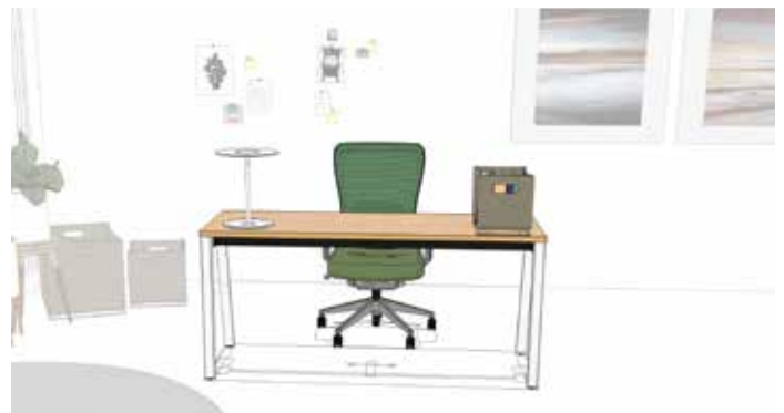
Home Office: Medium