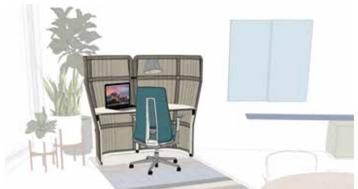
Home Office: Extra Large