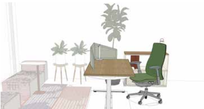
Home Office: Large