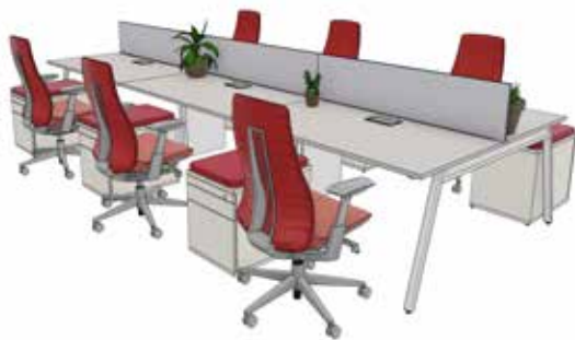
Office: Status Quo

Reguläre Grundreinigungen und Verhaltensregeln der Hygiene werden zu einem normalen Bestandteil des Arbeitslebens. Das könnte dazu führen, dass auch größere Investments in eine bessere Aufbereitung der Innenluft und in Biophilia vorgenommen werden. Pflanzen können dazu beitragen, natürliche Sichtachsen zu unterbrechen und die Qualität eines Raumes zu verbessern. Zusätzlich dazu können Oberflächen mit antibakteriellen Eigenschaften zu einem höheren Sicherheitsgefühl beitragen, auch wenn sie gegen Verbreitung von Viren wenig ausrichten können. Wir glauben daran, dass diese Maßnahmen nachhaltig die Gestaltung von Arbeitswelten positiv beeinflussen und dazu beitragen, potenzielle Mitarbeiter nicht nur anzuziehen, sondern auch zu behalten.